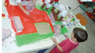
Maternal II monta maquete representando o Cruzeirozinho nos dias de hoje.