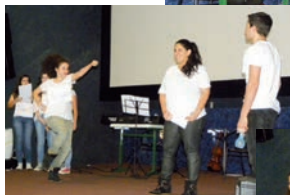
Alunos de Teatro e de Dança se apresentam na premiação do Concurso Literário.