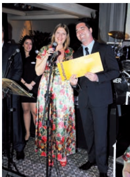
O sorteio de brindes foi uma das atrações da festa.