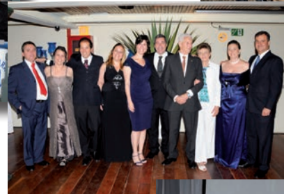
Membros da Diretoria da SBH.