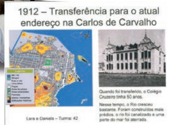
Trabalho do 4º ano mostra transformações históricas e geográficas dos últimos 150 anos.