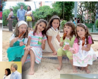
Os alunos do 5º ano produziram um diário, com o registro dos episódios mais importantes para eles (ao lado e abaixo).