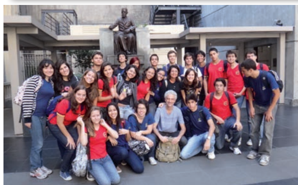
Nas fotos, alunos da Turma 300 em visita à Academia Brasileira de Letras.

A Academia Brasileira de Letras tornou-se uma visita obrigatória para os alunos da 3ª série do Ensino Médio. A visita começa na sede da ABL, construção que é uma réplica do Petit Trianon francês, situado em Versailles. Por meio de fatos e histórias curiosas da vida e obra dos acadêmicos, contadas e cantadas por um grupo de atores, os alunos se aprofundam no conhecimento da Literatura brasileira e conhecem a função sócio-cultural da Academia.