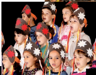
Nas fotos, alunos da Educação Infantil e do 1º ano se apresentam no auditório cantando músicas em Alemão.