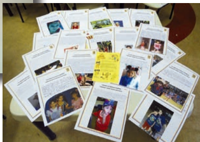
Na foto acima, trabalhos da Pré-escola II sobre os momentos marcantes no Colégio.