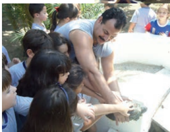
Alunos do 2º ano visitam o Retiro Humboldt e aprendem os cuidados que devem ter com a natureza.