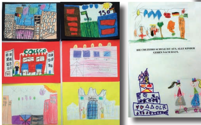
Acima, à esquerda, desenho dos alunos do 1º ano. À direita, produção das turmas da Pré-escola II