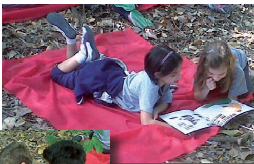
Na mata do Colégio, os alunos fazem uma leitura compartilhada aproveitando o contato com a natureza.