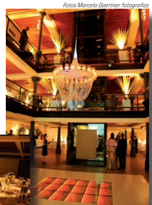
A decoração elegante do Baile, que contou com jantar e apresentação da Orquestra Tabajara.