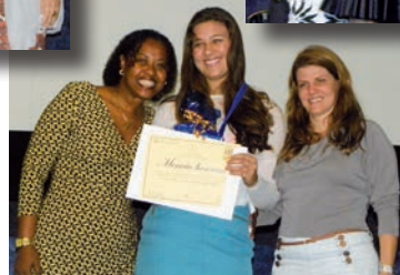
Nas fotos acima e ao lado, alunas recebem premiação na Categoria II e I.