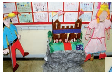
Acima, trabalho dos alunos da Pré-escola I e, ao lado, alunos da Pré-escola II: entrevistas, pesquisa e montagem de murais sobre o Colégio Cruzeiro e a Alemanha.

A Pré-escola I entrevistou o Diretor da escola, escolheu um mascote para cada turma, realizou trabalhos sobre a Alemanha e participou da simulação de uma viagem ao país, devidamente caracterizada.