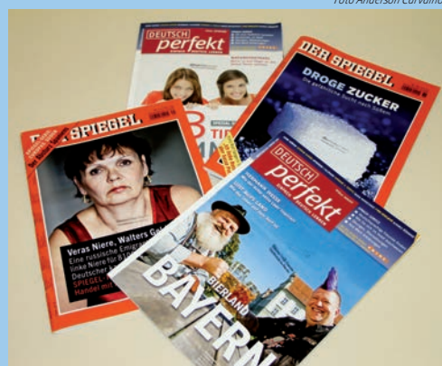
As revistas alemãs que fazem parte do acervo do Colégio Cruzeiro: objetivo é complementar o estudo dos alunos.

Com a finalidade de informar e dar suporte aos alunos, principalmente aos grupos que realizam os exames DSD I e DSD II, as revistas estão disponíveis para consulta na Biblioteca da escola e com os professores de Língua Alemã. Comunicação