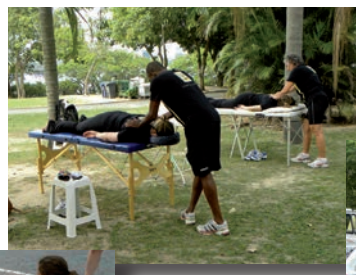
Momento de relaxamento com sessões de massoterapia.