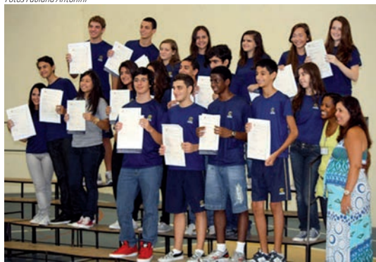
Nas unidades Centro (fotos da direita) e Jacarepaguá (fotos da esquerda), alunos do 6º ano ao Ensino Médio realizam as

provas de Inglês, promovidas pela Universidade de Cambridge, e recebem os certificados de proficiência em cerimônia organizada pelas equipes de Inglês de cada unidade.