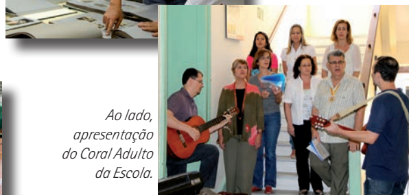
Ao lado, apresentação do Coral Adulto da Escola.