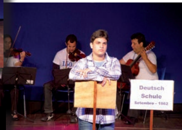
O espetáculo reuniu diversas linguagens artísticas, como música e artes plásticas.