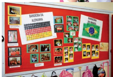
Os três andares do Cruzeiroirinho ficaram enfeitados com os murais montados pelos alunos do segmento.

confecção das camisetas com o slogan "Nós fazemos parte dessa história" e ainda a confecção de um mural representando uma colônia alemã.