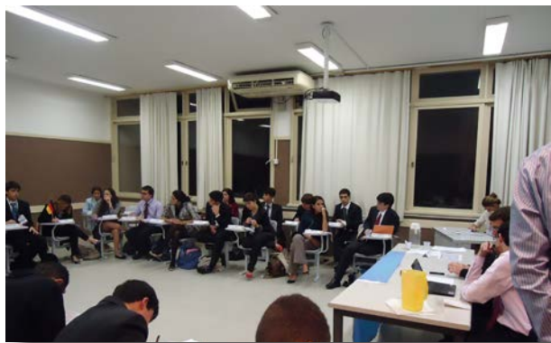
Alunos em ação.