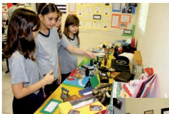
Ao lado, alunos observam objetos antigos, que fazem parte do acervo do Colégio Cruzeiro.

O 2º ano apresentou dois projetos: "A história do Colégio Cruzeiro", contada através de uma linha do tempo composta de entrevistas com os funcionários, fotos, objetos antigos e atuais do Colégio e de um jornal mural, e a "Biografia de Luiz Gonzaga".