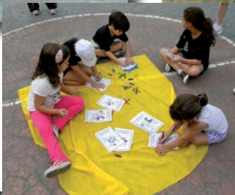
Equipe de recreadores para animar a garotada.