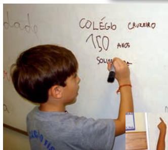
1º ano se reúne para produção de texto coletivo em comemoração aos 150 anos.