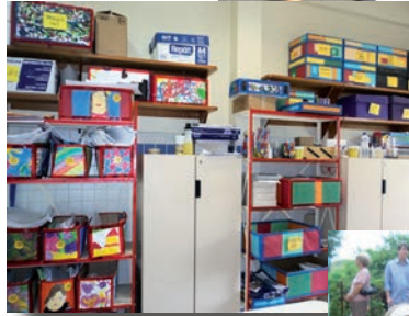
Meus locais preferidos: nas turmas do 2º ano, os alunos selecionaram seus "pontos turísticos" na escola e registraram em fotos (acima e ao lado).