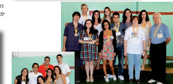
Ex-alunos dos anos 1990 (ao lado) e 2000 (acima).