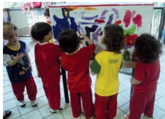
Maternal I enfeita caixa de presente para coleta de mensagens.