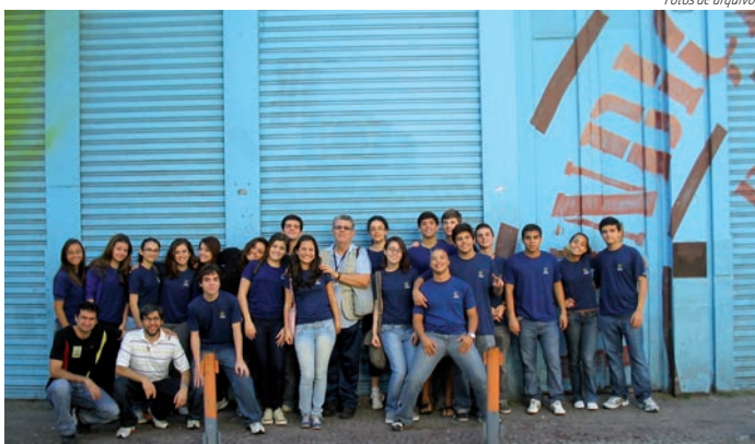
Caminhada Cultural: alunos da 2ª série do Ensino Médio em frente ao local onde funcionou o Colégio Cruzeiro em 1864.

"Desde a Rua Carlos de Carvalho até a Praça XV, com 4 horas de caminhada, retornamos ao passado por ruas, lojas, vielas, igrejas e velhos sobrados, alguns dos lugares que, naqueles dias, tornaram-se a nossa sala de aula", explicou o Professor, que acompanhou, nos dias 02 e 03 de julho, um grupo de alunos da 2ª