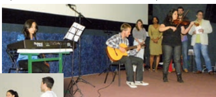
Alunos realizam apresentação musical.