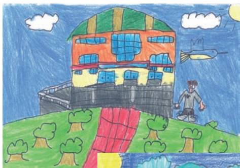
O mundo da poesia: desenhos dos alunos do 4º ano.