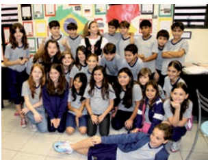
A colonização alemã foi destaque no trabalho dos alunos do 5º ano.

Já o 4º ano contribuiu com um conteúdo integrado das disciplinas de História e Geografia, apresentando, através de mapas, maquetes, fotos e reportagens, as transforma-