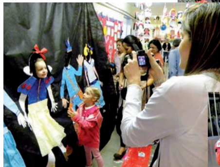
No hall do Cruzeiroinho, murais decorados com trabalhos dos alunos e um painel com personagens para tirar foto.