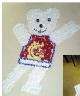
Na foto ao lado, urso do uniforme da Educação Infantil produzido pela Pré-escola I, através de colagem.