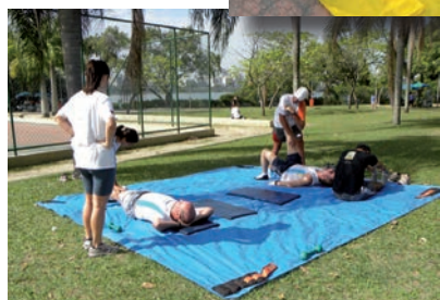
Alongamento após a atividade.