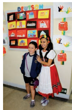
A Alemanha também foi tema da exposição.