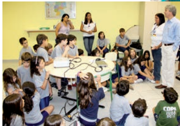
As turmas do 3º ano visitaram o Colégio Cruzeiro – Centro e conversaram com professores e com o Diretor da unidade.