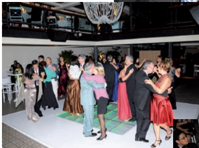
Casais dançam ao som da Orquestra.