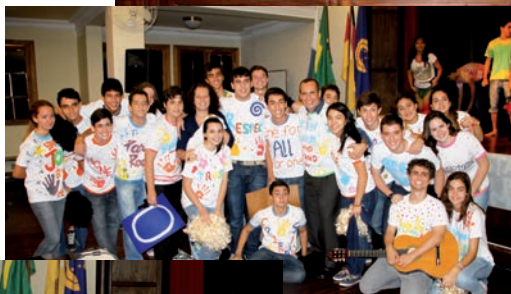
Nas fotos acima e ao lado, os grupos vencedores do jogral: "Aquarius", da turma 104, 1º lugar, e "Stand by me", da turma 103, 2º lugar.