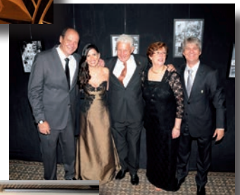
Ao lado, diretores e vice-diretoras das duas unidades do Colégio Cruzeiro com o Presidente da SBH.