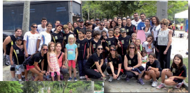
Caminhada corrida 2012: pais, alunos, ex-alunos, funcionários, professores e Diretoria da SBH divididos em cinco equipes.