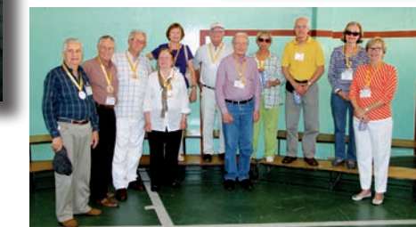
Ex-alunos da década de 1950.