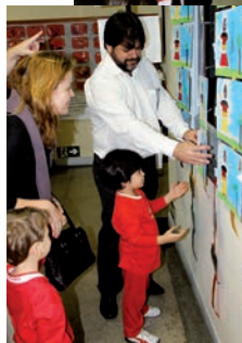
No Cruzeiroirinho, pais e alunos visitam a exposição sobre os 150 anos do Colégio Cruzeiro.