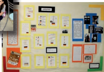
Ao lado, mural organizado e montado pelas turmas do 5º ano: "Aspectos demográficos do Brasil"