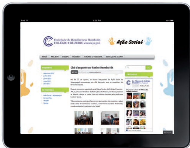
Página inicial do Blog da unidade de Jacarepaguá.

até fotos e publicações antigas e atuais sobre o que acontece na Ação Social, além de um "Espaço do aluno", no qual os voluntários podem postar suas opiniões sobre o trabalho e sobre os textos publicados.