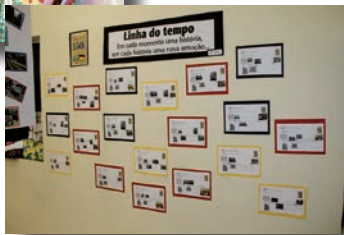
Linha do Tempo montada pelas turmas do 2º ano traça um histórico dos 150 anos da instituição.