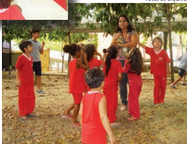
Estudando o Folclore brasileiro: alunos procuram os bolinhos de chuva escondidos na floresta.

Durante o mês de agosto, os alunos do TICC da Pré-escola I e da Pré-escola II realizaram atividades diversificadas sobre o Folclore Brasileiro.