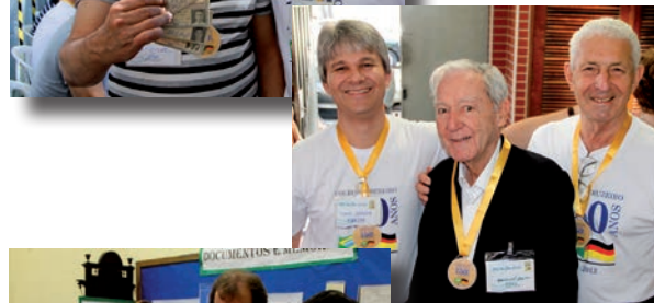
No ano comemorativo dos 150 anos do Colégio Cruzeiro, ex-alunos são presenteados com medalhas.