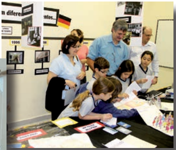
Para pesquisar o Centro do Rio ontem e hoje (acima), os alunos do 3º ano participaram de um trabalho ao quarteirão da Escola (ao lado).

ções na paisagem e na organização do município do Rio de Janeiro ao longo dos últimos 150 anos, e fazendo uma análise das mudanças que o Colégio presenciou.