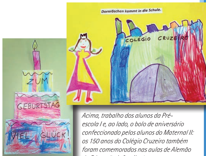
Acima, trabalho dos alunos da Pré-escola I e, ao lado, o bolo de aniversário confeccionado pelos alunos do Maternal II: os 150 anos do Colégio Cruzeiro também foram comemorados nas aulas de Alemão da Educação Infantil e 1º ano.

Nas turmas da Pré-escola I, o conto de fadas "Dornröschen" foi adaptado pelas crianças em conjunto com as professoras: após provar o bolo da bruxa, a princesa dormiu por 150 anos e foi despertada pelos alunos para participar do baile da escola. Cada turma elaborou um livro para ilustrar a história e, com essa atividade, as crianças puderam mesclar fantasia e realidade.