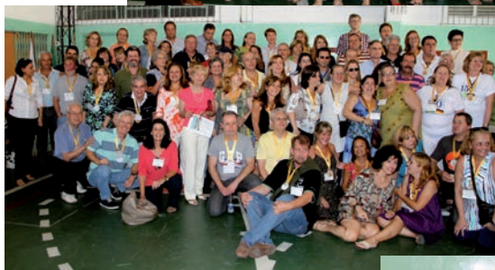
Abaixo, ex-alunos das décadas de 30 e 40.