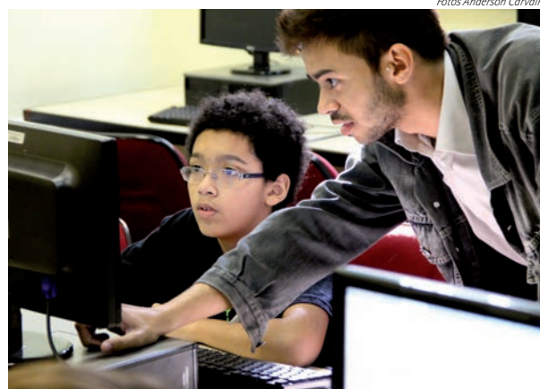
... e recebem treinamento para utilizar a ferramenta.