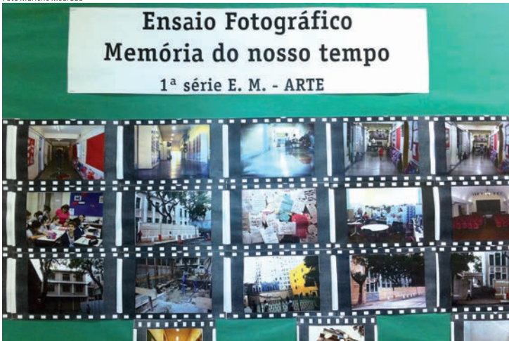
Mural com o registro fotográfico dos alunos da 1ª série do Ensino Médio: "resgate do significado de ser um aluno do Colégio Cruzeiro".

Os alunos da 1ª série do Ensino Médio do Colégio Cruzeiro - Centro desenvolveram, ao longo do ano, o projeto "Memórias do meu tempo", durante as aulas de Arte.