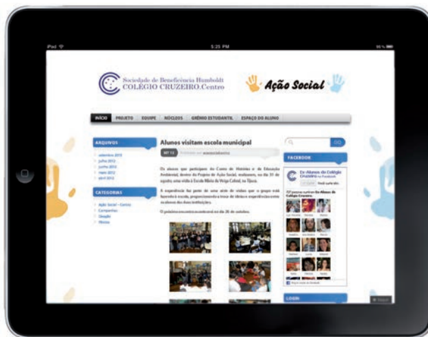
Página inicial do Blog da unidade Centro.

O blog conta também com informações essenciais do projeto, desde o histórico, equipe, núcleos e projetos