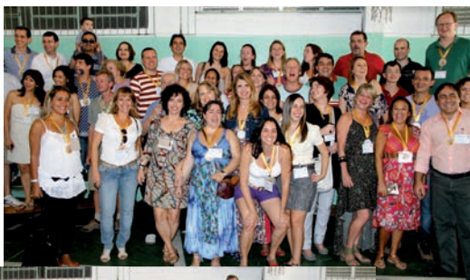
Nas fotos ao lado e abaixo, alunos das décadas de 1970 e 1980.