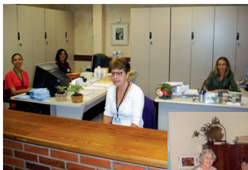
Nas fotos três momentos da Secretaria: em 2007 (acima), em 1987 (ao lado) e em 1964 (abaixo): o setor é o guardião da memória da escola.