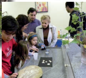
Ao lado, pais, filhos e familiares conhecem um pouco mais sobre algumas experiências científicas. Abaixo, atividades esportivas.