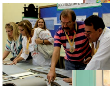
Exposição do Memorial 150 anos exibe objetos antigos, fotos e recordações da instituição.