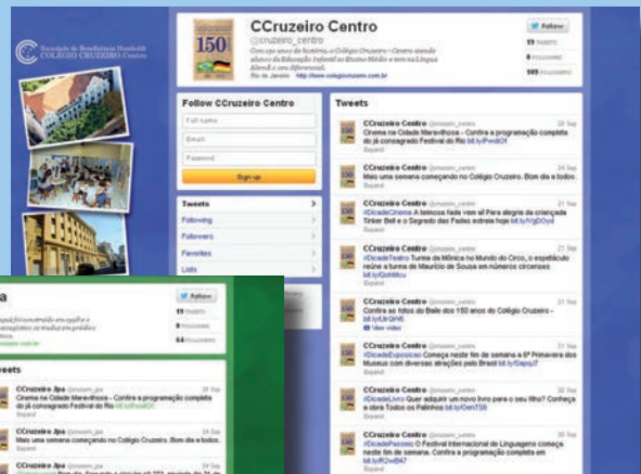
Acima, página do Twitter do Colégio Cruzeiro - Centro: divulgação de eventos, atividades e assuntos relacionados à Educação.