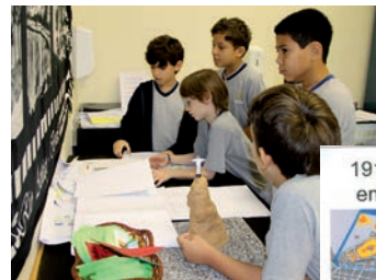
Fotos, maquete, mapas e reportagens ilustraram o trabalho das turmas do 4º ano.

Além desses projetos, a equipe de Língua Portuguesa produziu o projeto "Cruzeiro de histórias", em que, por meio de relatos pessoais, os alunos também se sentiram pertencendo e escrevendo a história do Colégio. Comunicação