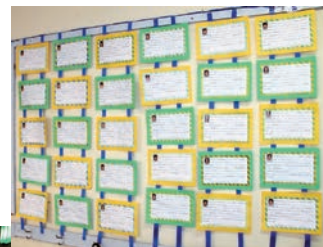
Acima, textos dos alunos do 1º ano: "Minha vida no Cruzeiro". Ao lado, pais orgulhosos, fotografam os filhos.