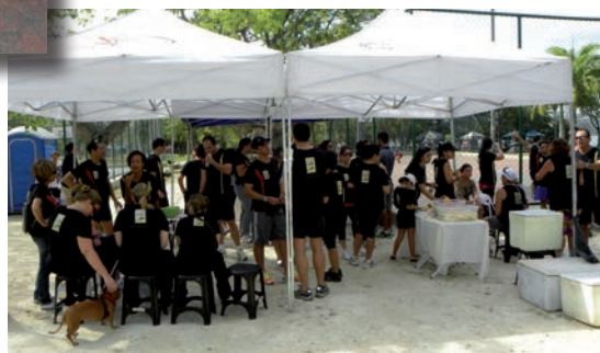
Ao final da manhã, frutas e sucos para repor as energias.