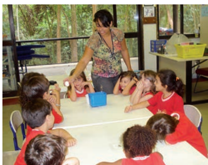
Ao lado, alunos da Pré-escola participam de uma oficina culinária e preparam bolinhos de chuva.