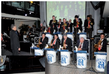
A Orquestra Tabajara foi a grande atração da noite.